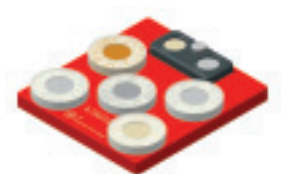
47A010 サンプルホルダー 5

導電率測定用標準試験片を収納する専用ホルダー3 (部品番号47A025) および5 (部品番号47A010) があります。